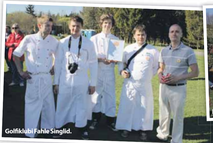
Golfklubi Fahle Singlid.