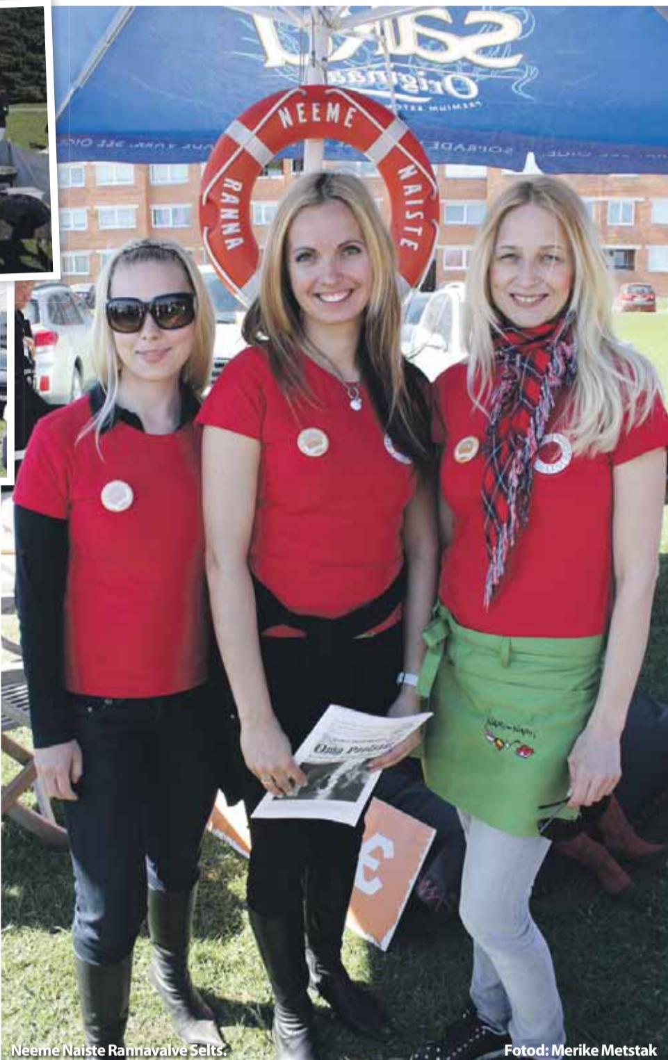
Neeme Naiste Rannavalve Selts.